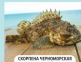
СКОРПЕНА ЧЕРНОМОРСКАЯ (МОРСКОЙ ЕРШ)